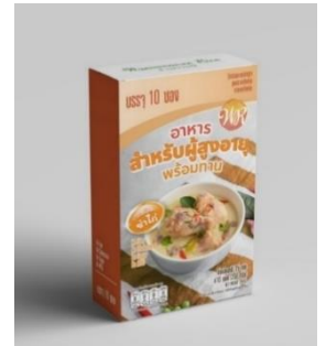
ภาพตัวอย่างผลิตภัณฑ์ภายในโครงการ