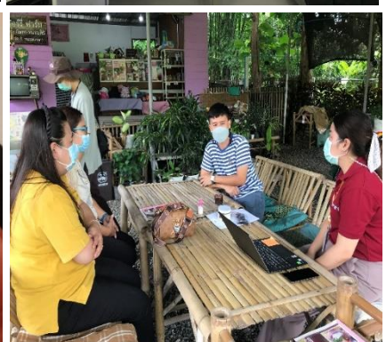
ภาพการดำเนินงานของโครงการ